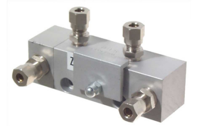
DEV-SA mit Einschraubern